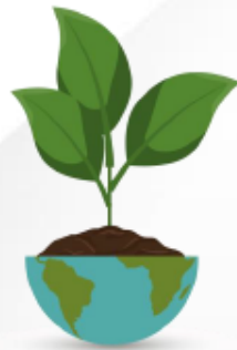
Cuidado y preservación del medio ambiente