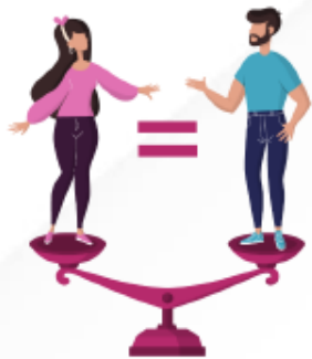
Equidad de género

Busca fortalecer los valores y la sana convivencia a través de las prácticas deportivas y sus diferentes manifestaciones de manera sostenible y articulada. Beneficia a la población adulta comprendida entre los 18 y 60 años, perteneciente a grupos poblacionales que por diferentes variables, poseen mayores niveles de vulnerabilidad en comparación a otros, y que se encuentran soportados y priorizados en la legislación colombiana.